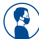
PORT DU MASQUE OBLIGATOIRE

Mesures spécifiques d'adaptation concernant pour les espaces et prestations d'hospitalité