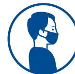
PORT DU MASQUE OBLIGATOIRE

Mesures spécifiques d'adaptation concernant pour les espaces et prestations d'hospitalité