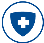
PASS SANITAIRE * VALIDE