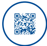
QR CODE OBLIGATOIRE