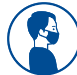
PORT DU MASQUE OBLIGATOIRE

Mesures spécifiques d'adaptation concernant pour les espaces et prestations d'hospitalité